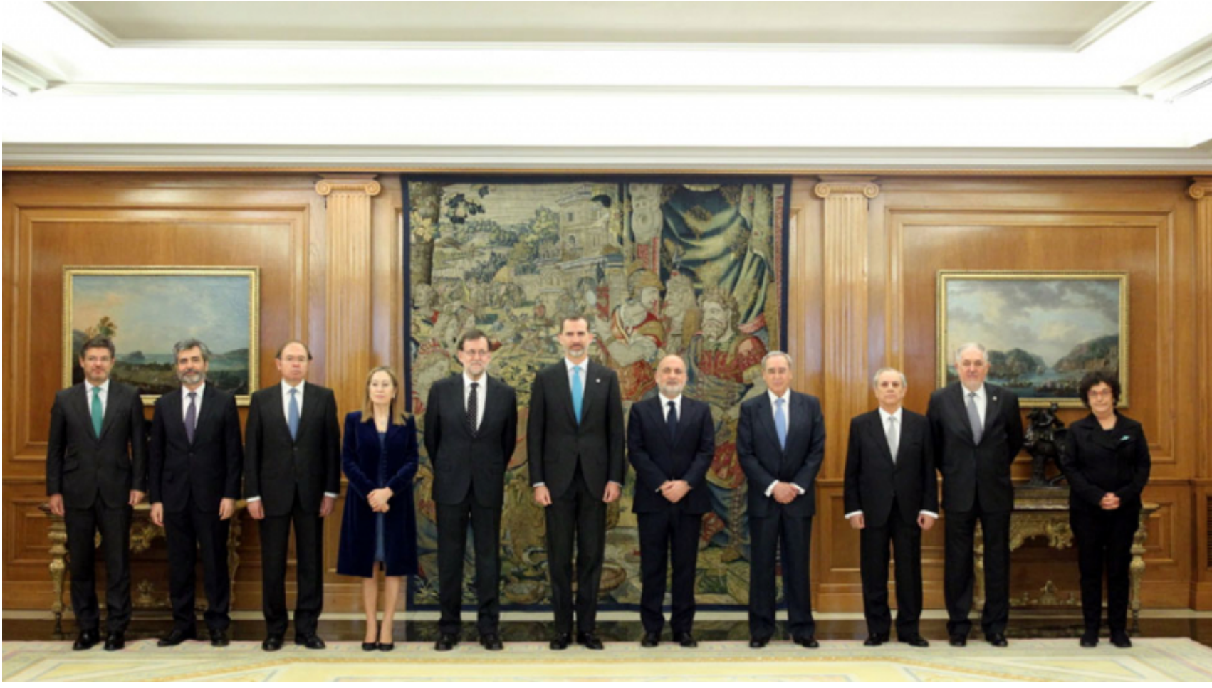
Toma de posesión de los cuatro nuevos magistrados del Tribunal Constitucional

Como estaba previsto tras la elección la pasada semana por el Pleno del Senado , a propuesta de Asambleas Legislativas de varias Comunidades Autónomas , de 4 nuevos magistrados del Tribunal Constitucional , ayer han tomado posesión de sus cargos en el Palacio de la Zarzuela en un acto presidido por el Rey, bajo la atenta y complaciente mirada de Mariano Rajoy , Ana Pastor , Pío García-Escudero , Carlos Lesmes y el ministro de Justicia, Rafael Catalá .