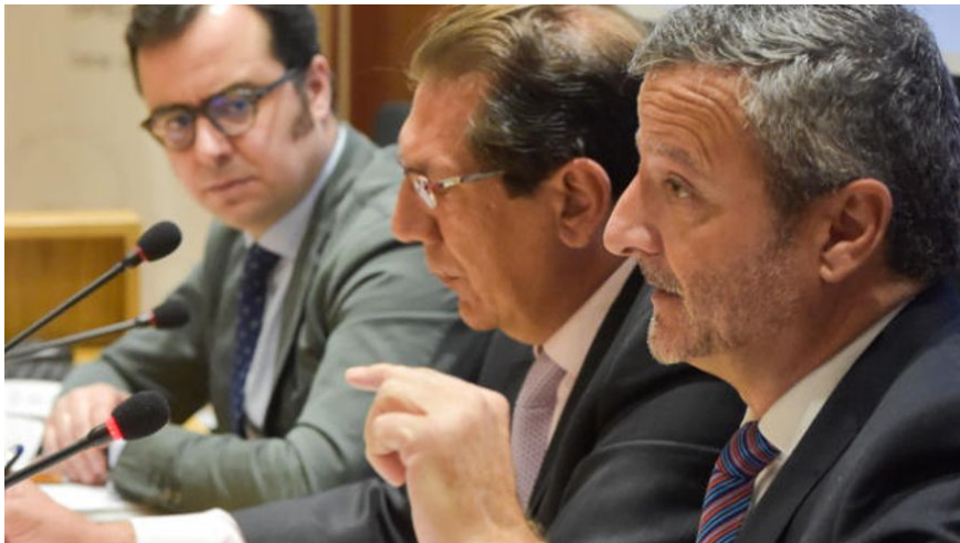
Las pymes acrecientan las medidas antidelito de directivos y empleados