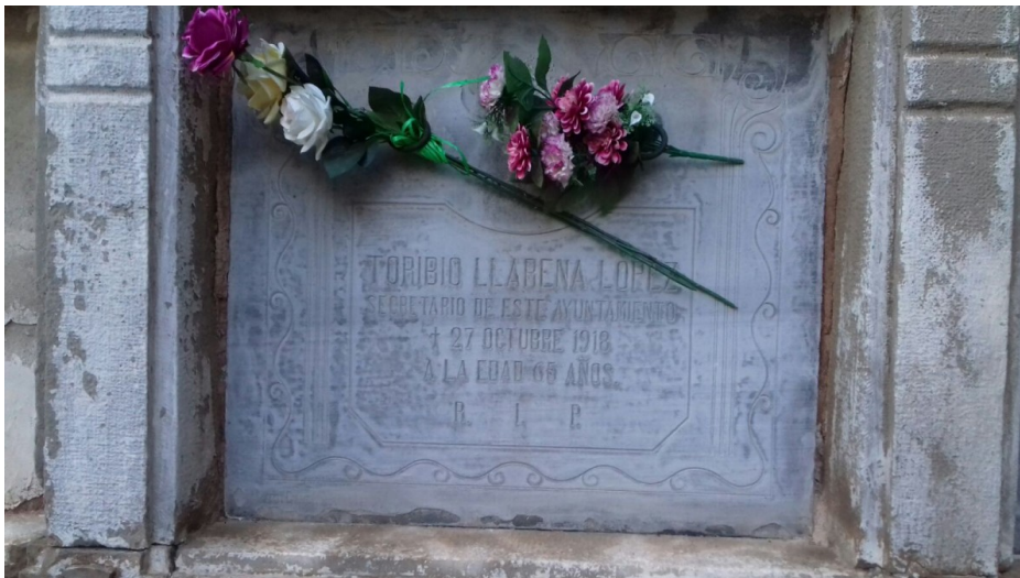
Nínxol del besavi de Llarena, que ha permès a un mestre descobrir la història de l'avi del jutge del Suprem

(https://www.naciodigital.cat/pdf.php?id=152689)