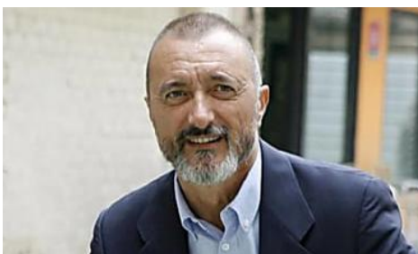
Pérez-Reverte se une a una discusión de pareja en Twitter de la forma más cómica