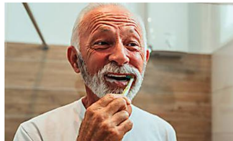
Olvídate de los cepillos de dientes eléctricos —¡Esto es el futuro!