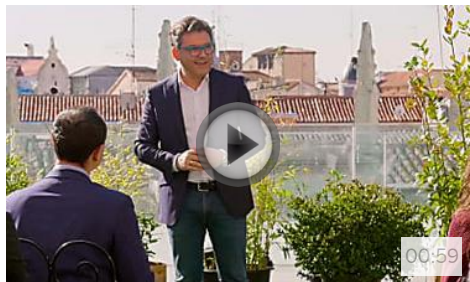
Después del Coworking llega el Coliving