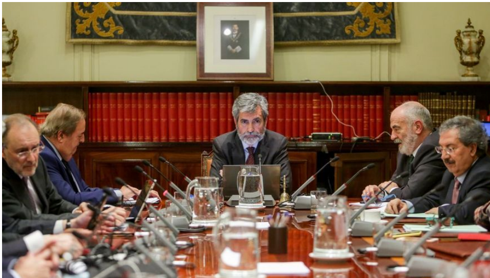
Reunión del pleno del CGPJ presidida por Carlos Lesmes.