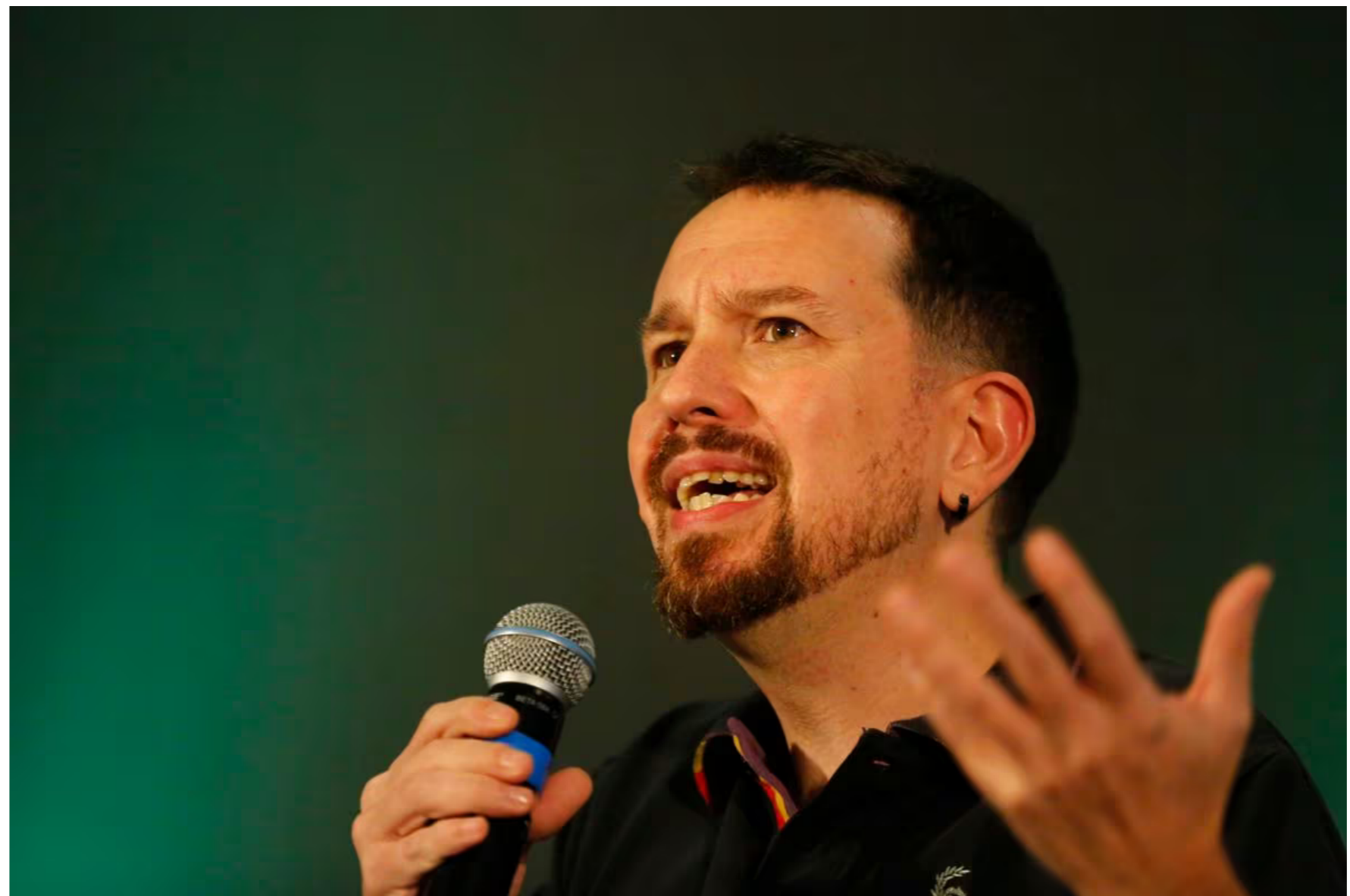
El exsecretario general de Podemos, Pablo Iglesias.

Los jueces han desmontado todas las causas contra la formación morada, pero los falsos acusadores siguen impunes