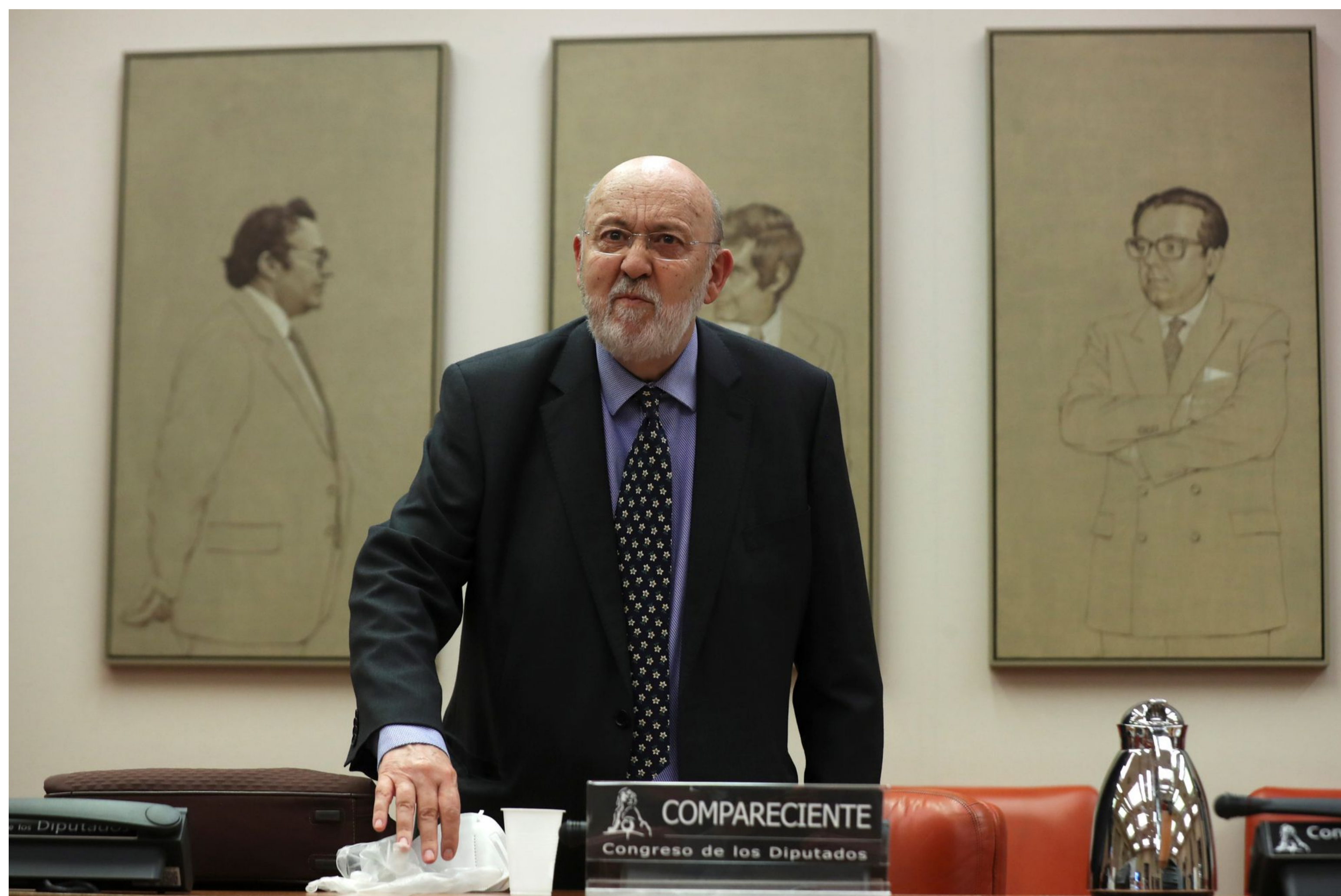
El presidente del Centro de Investigaciones Sociológicas, José Félix Tezanos, en el Congreso de los Diputados el año pasado.

La citación del presidente del CIS, fijada para el 29 de octubre, se produce después de que la Fiscalía y la Abogacía del Estado pidiesen el archivo de la querrela de Vox