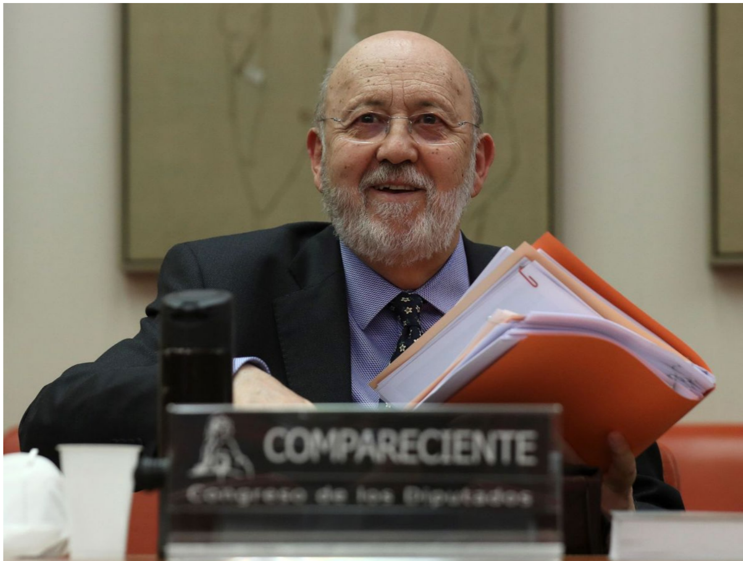
El presidente del Centro de Investigaciones Sociológicas, José Felix Tezanos.

Entiende que la denuncia no cumple los presupuestos necesarios que puedan legitimar el inicio de una investigación judicial por la presunta comisión de un delito de malversación