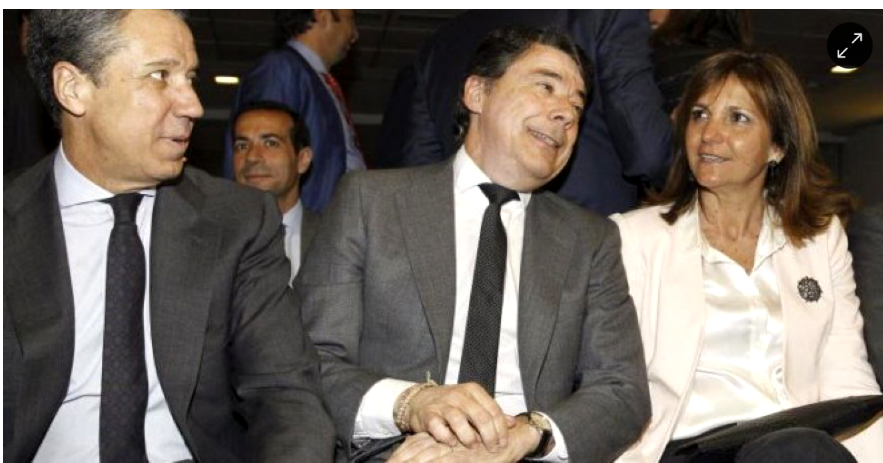
Eduardo Zaplana e Ignacio González, junto a la mujer del expresidente de la Comunidad de Madrid.

MADRID, 28/04/2017 18:36 • ACTUALIZADO: 28/04/2017 18:37