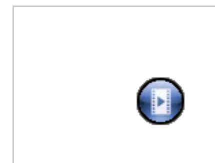
Discurso Presidente FEMP/2 27/09/2011