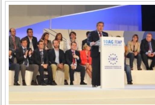
Juan Ignacio Zoido con su Junta de Gobierno 24/09/2011