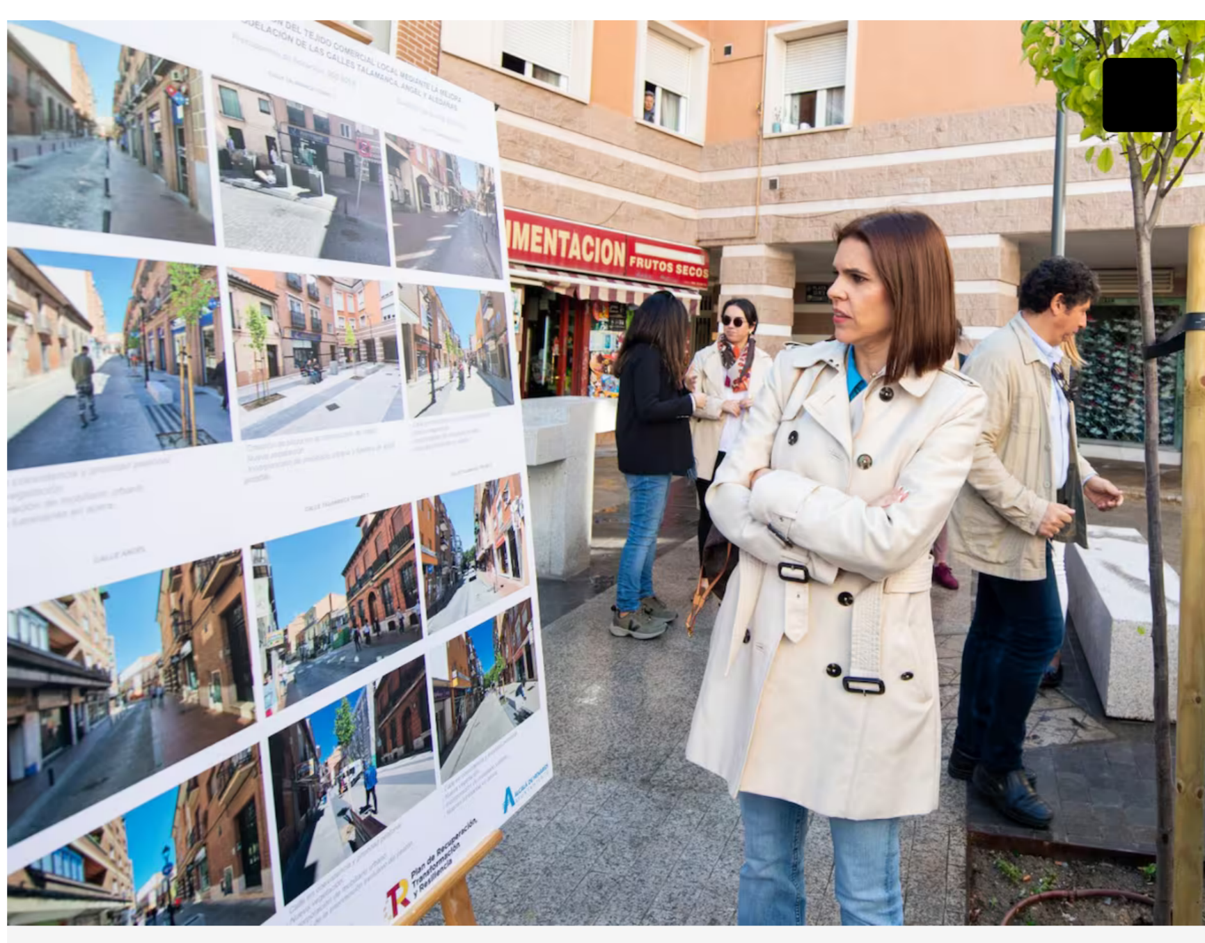
Ayuntamiento de Alcalá de Henares

El PSOE denunció la difusión de su acción de gobierno en la revista municipal, una visita de obras y una inauguración tras la convocatoria de las elecciones al Parlamento Europeo