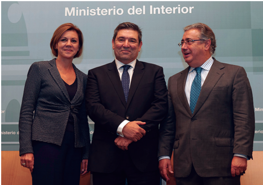
Ministerio del Interior