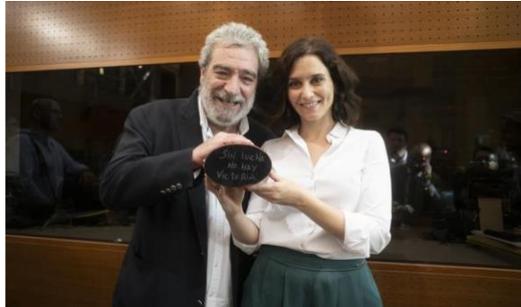
IDA y MAR. Agosto 2019

LOS GENOVESES Domingo, 18 de abril de 2021