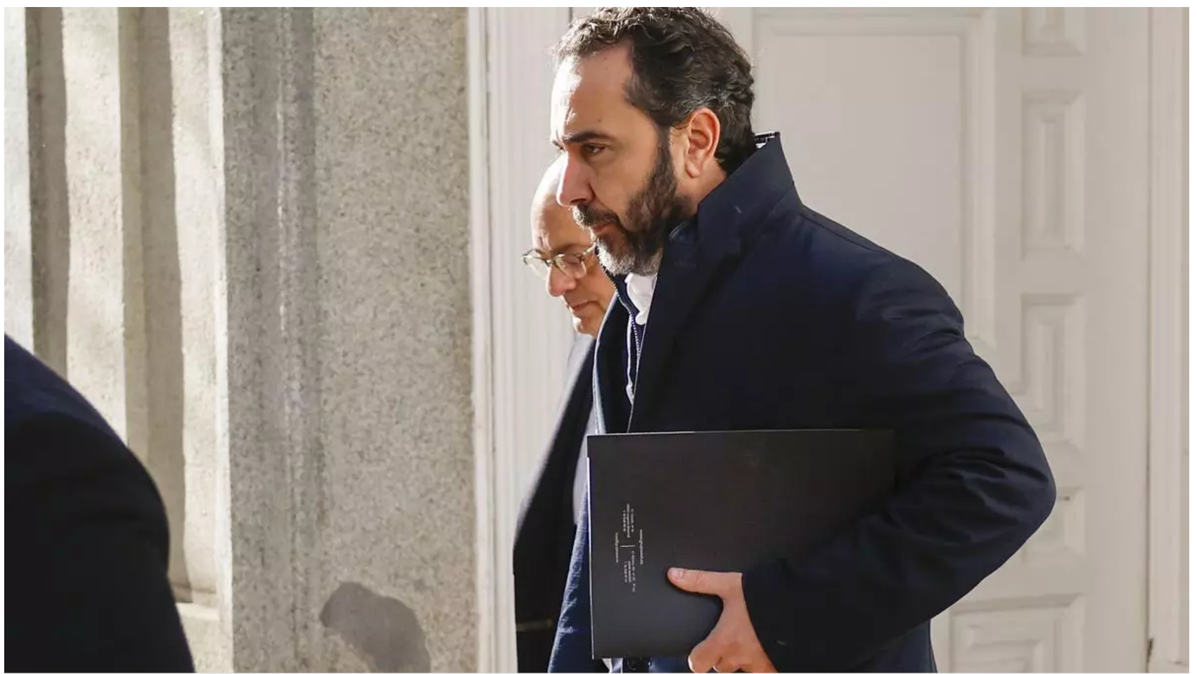
El empresario Víctor de Aldama, en una imagen saliendo de un juzgado.

elDiario.es 22 de enero de 2025 11:04 h Actualizado el 22/01/2025 11:17 h 4