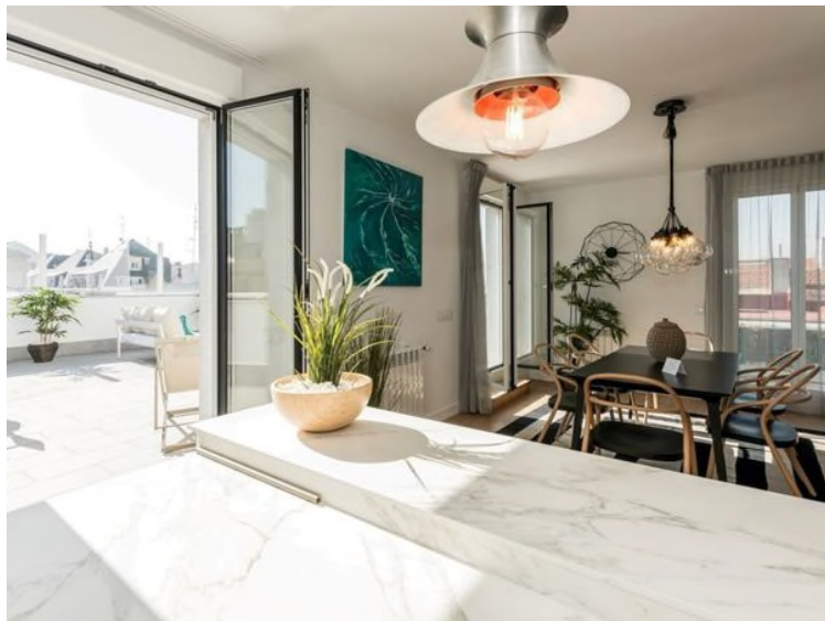
Vistas del Hotel Be Mate Plaza España donde se aloja Isabel Díaz Ayuso

esenciales y a los huéspedes alojados antes del Estado de alarma.