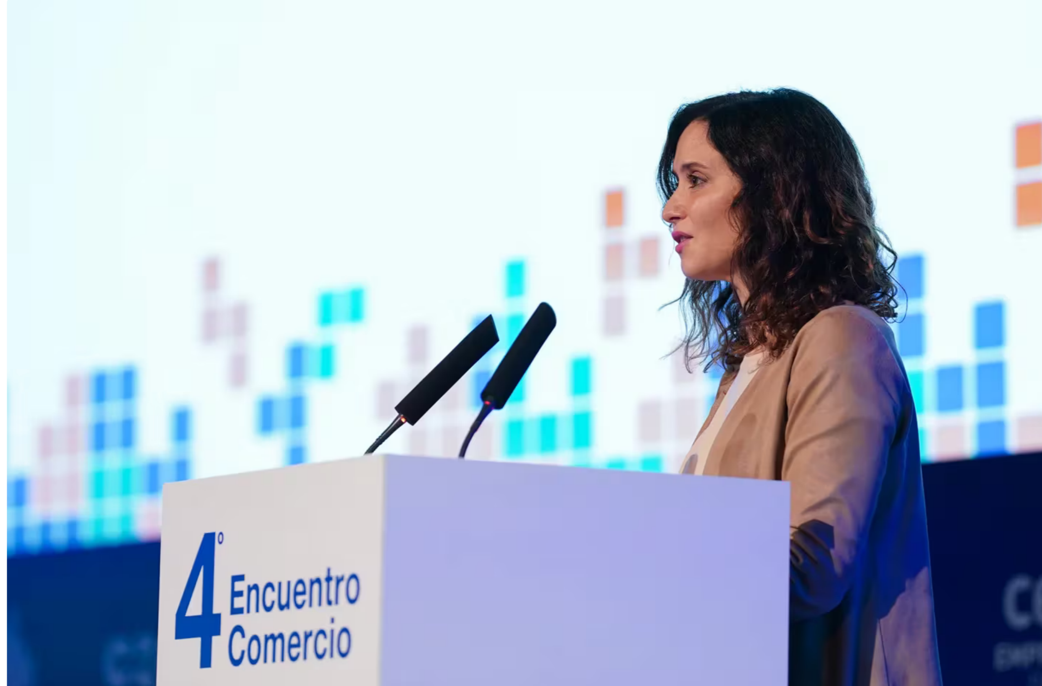
La presidenta de la Comunidad de Madrid, Isabel Díaz Ayuso

La Comunidad de Madrid reconoce que ha pagado desde 2019, año en el que Isabel Díaz Ayuso llegó al poder, nueve millones de euros a la empresa Quirón Prevención , filial del Grupo QuirónSalud . Fuentes de la Consejería de Sanidad admiten estos pagos dentro del marco de una relación contractual normal, ya que esta empresa, especializada en prevención de riesgos laborales, suele contratar sus servicios con todo tipo de administraciones. De hecho, "desde el año 2019 ha facturado 15 veces más al Gobierno de España, con adjudicaciones que suman 160 millones de euros, y seis veces más al resto de Gobiernos regionales, que han pagado un total de 57 millones por sus servicios".