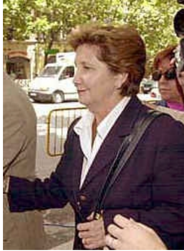
La hermana del amigo del Presidente