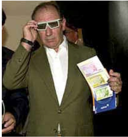
Lo sabe todo y además lo está viendo