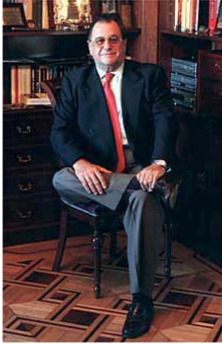
El cazador cazado