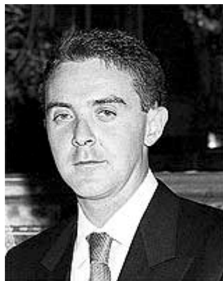
El Monosabio nº 1