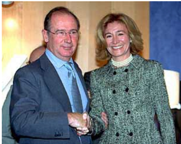
El Jefe con su Comercial en la CNMV