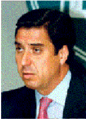
Está en todos los fregaos