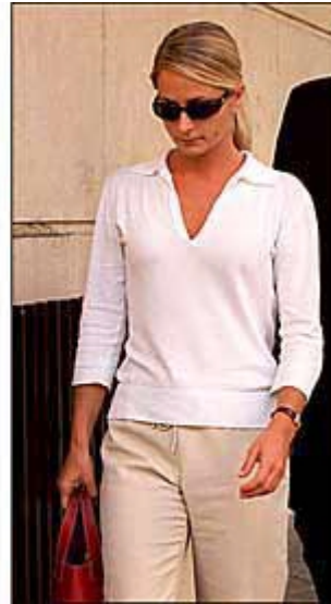
Padre e Hija