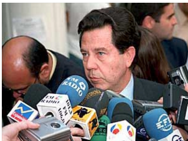
El amigo familiar de nuestro Presidente