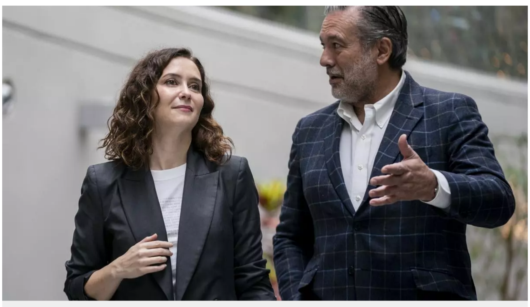
Isabel Díaz Ayuso y Enrique López.

5 de diciembre de 2024 22:07 h Actualizado el 06/12/2024 05:30 h 98