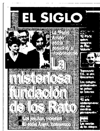
El SIGLO desveló hace unas semanas la existencia de una polémica fundación creada y dirigida por los Rato y los Salazar-Simpsons a la que aportan donativos algunas de las empresas de la familia.

Con tantos talones de Aquiles tan tocados, la vida política de Rodrigo Rato se tambalea a marchas forzadas. El es un buen fajador, pero al ring han saltado demasiados contrincantes, con guantes y sin ellos, esgrimiendo contra el vicepresidente hechos muy comprometidos y otros que esperan el momento oportuno para ser desvelados. Están dispuestos a derribarle, aunque sea por KO técnico.