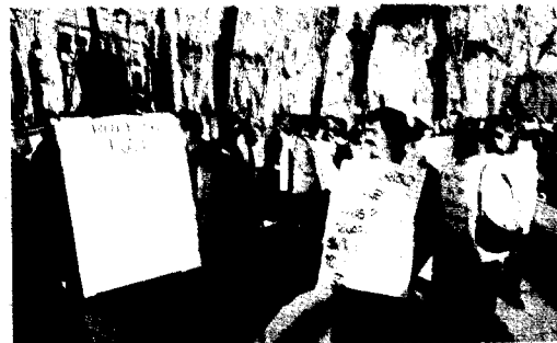
Rebecasa suspendió pagos y provocó protestas.

la sociedad patrimonial de Rodrigo Rato, la Seguridad Social la notificó en febrero de 1996 una deuda de 860.904 pesetas, correspondiente a los meses de