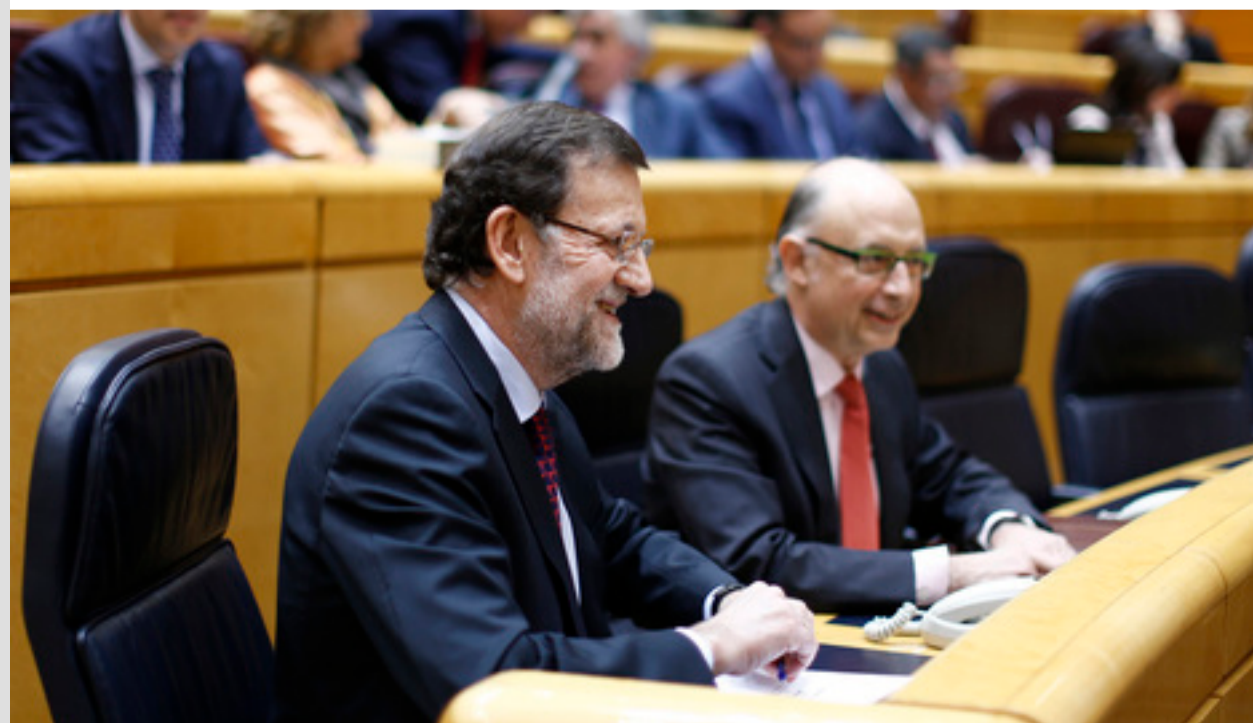
Mariano Rajoy y Cristóbal Montoro, en el pleno del Senado.

La nueva Ley de Emprendedores, aprobada definitivamente el pasado jueves con los votos del PP y CiU, esconde un suculento regalo para los alrededor de 1.200 registradores mercantiles y de la propiedad que operan hoy en España. A partir de la entrada en vigor de la ley, lo que se producirá antes de un mes, los autónomos que pretendan proteger su vivienda habitual de posibles embargos por deudas profesionales deberán inscribirse como "emprendedores de responsabilidad limitada" en el registro mercantil y dejar constancia del blindaje del inmueble en el registro de la propiedad. Esta norma protegerá a las