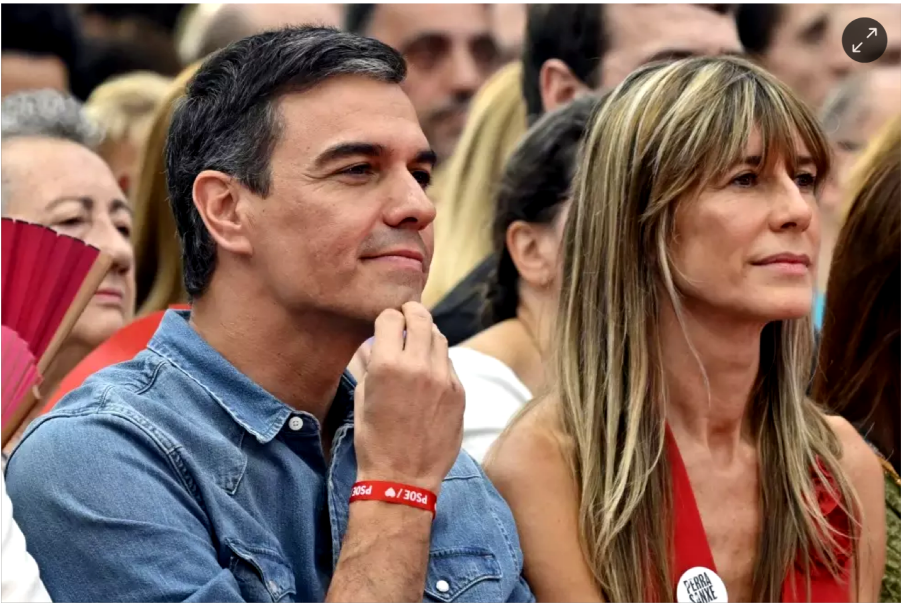
El presidente del Gobierno, Pedro Sánchez y su esposa, Begoña Gómez, en una foto de archivo del 21 de julio de 2023, días previos a las elecciones generales.